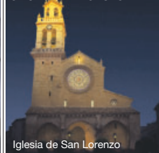
Iglesia de San Lorenzo