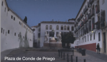
Plaza de Conde de Priego